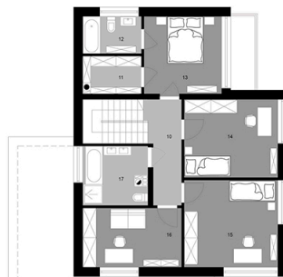
Piętro, poziom +0.00